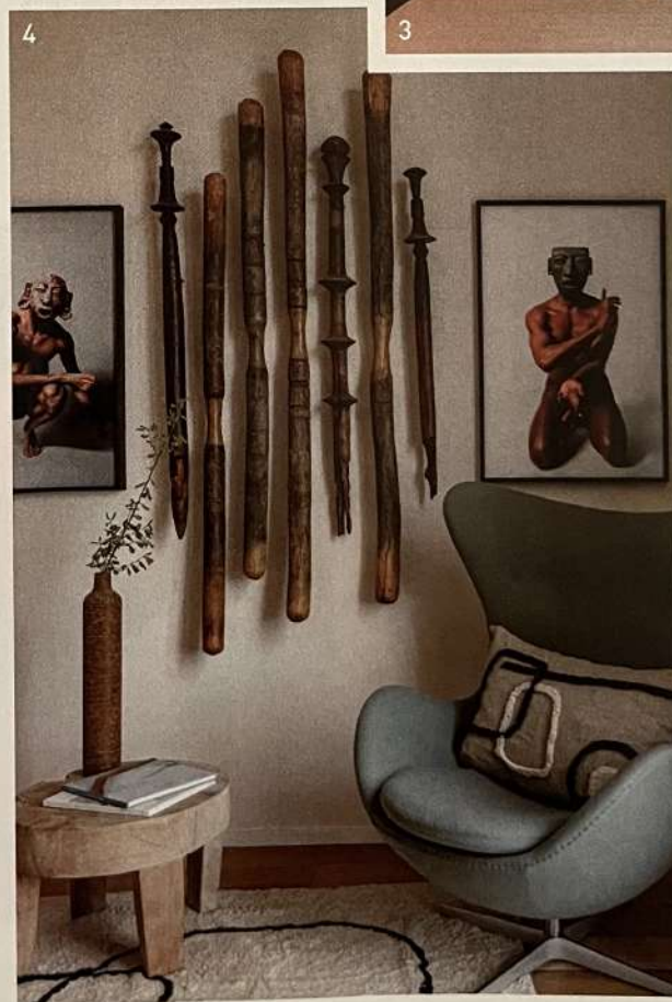
4. Marc et Rémy savent mieux que personne faire dialoguer meubles contemporains, pièces vintage et clichés des plus grands photographes.