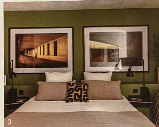
3. Une des cinq chambres d'hôtes, aménagées autour de l'impressionnante collection de photos des deux propriétaires.